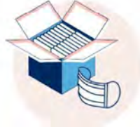
Mondmasker FFP1 - FFP2 Chirurgisch Mondmasker